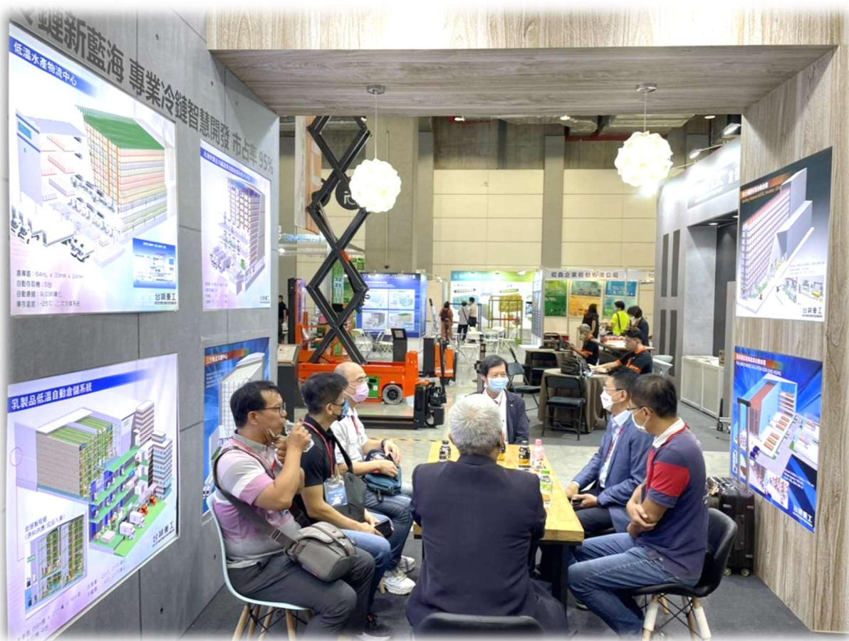
展场互动讨论情形