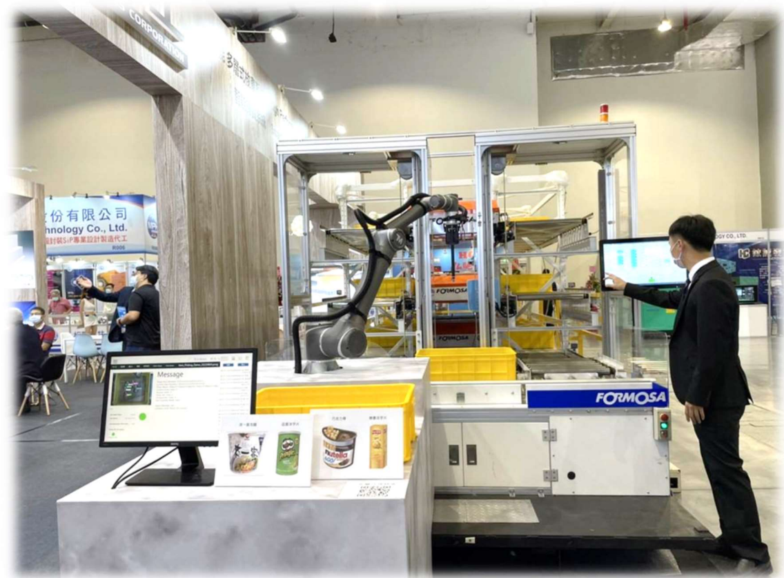
多层式穿梭车搭配机械手臂理货系统