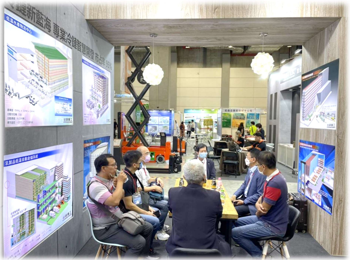
展場互動討論情形