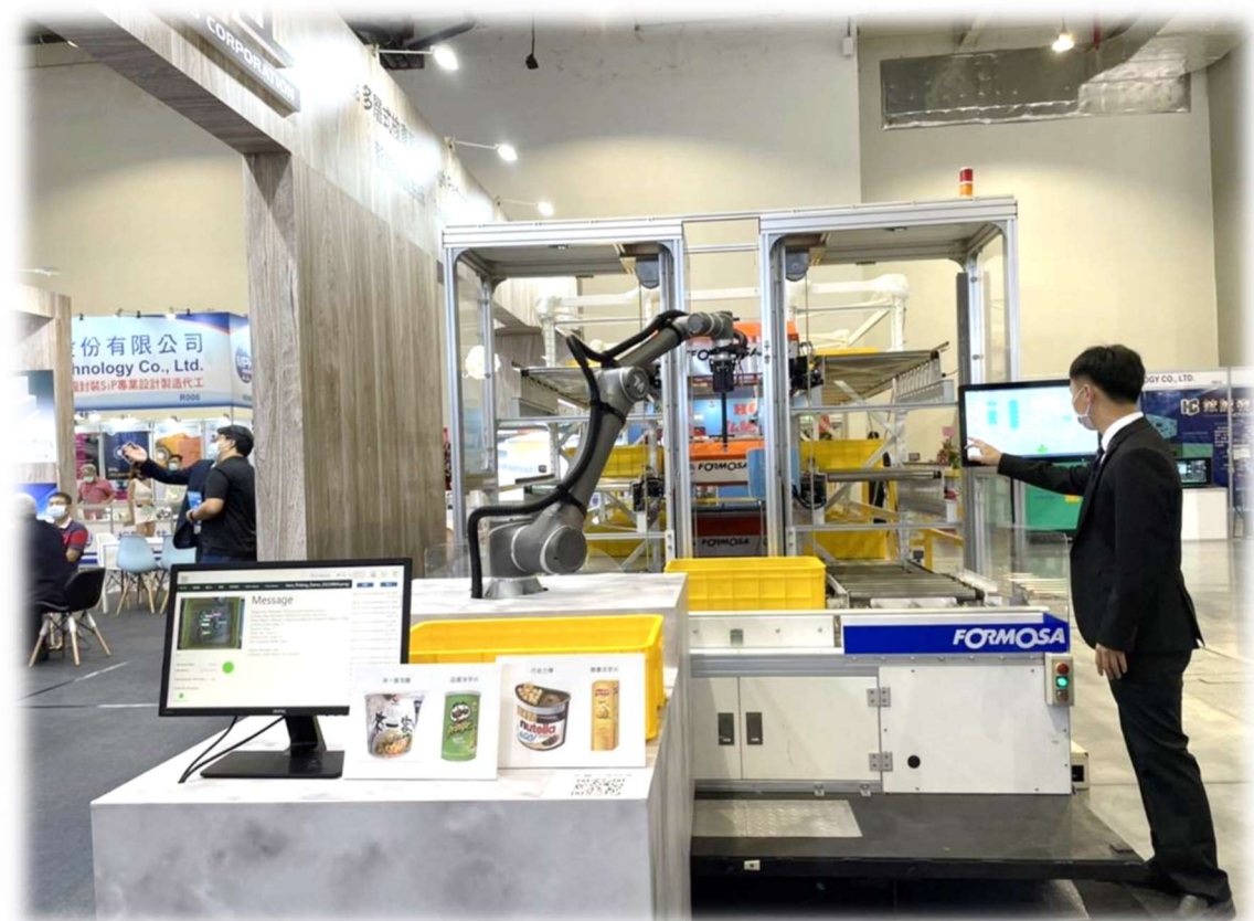
多層式穿梭車搭配機械手臂理貨系統